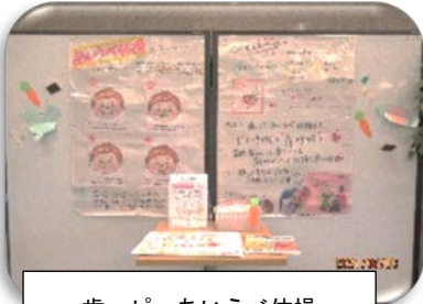
歯ッピーあいうべ体操

支援センター内の「まち活ギャラリー」は、登録団体、まち活パートナーズ、区内施設の活動団体の写真、絵画、作品などの展示発表の場です。2週間ごとに入れ替わるので、ぜひ見に来てください。また、発表したい団体などはどんどんご活用ください。（ご利用方法は支援センターまでお問合せください） ★これまでの素敵な展示の一例を紹介します★