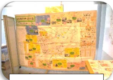
まっぴい・青葉の街