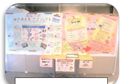
生涯学習講座紹介