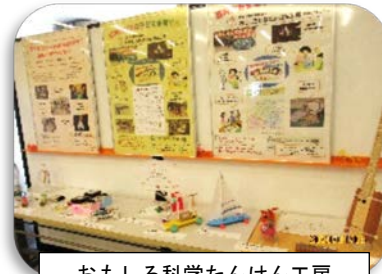
おもしろ科学たんけん工房 横浜北1地区