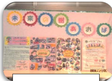
未来の樹・あおぼ