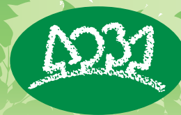
区のシンボルマーク