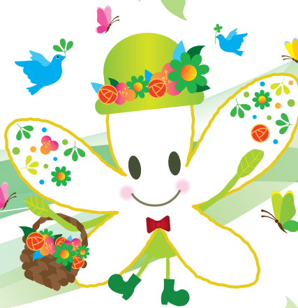
青葉区マスコットキャラクター なしかちゃん 園芸博PR版