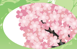
区の木/ヤマザクラ