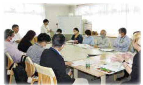
まちぐるみ福祉推進会議の様子

災害時支援の取組を検討するなかで、日常の見守りの大切さに改めて気づき、地域全体に見守りを広げるための取組を進めています。