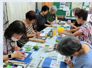
アドバイスを聞きながら 作成中