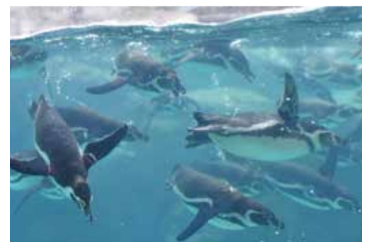
水中で魚を追う姿は、迫力満点！