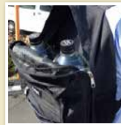
▲ペットボトルの入るリュックサック

災害時給水所に容器の用意はありません。水は重いので、自分の体力や自宅までの道(階段の有無など)に合った容器や運搬手段を準備しましょう。