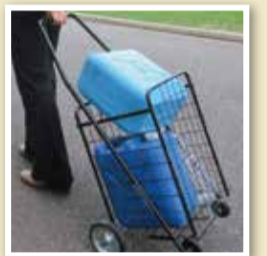
▲ポリタンクとカート