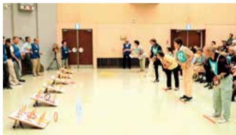
▲輪投げ大会の様子

「かがやきクラブ旭」は、旭区老人クラブの愛称です。1万人を超える会員が、毎日元気に楽しく活動し、仲間同士の支え合いの輪を広げ、地域のつながりを深めています。