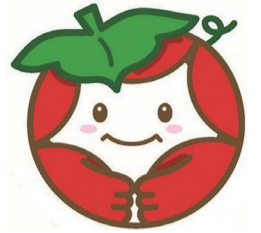
旭区の認知症に関する取組のシンボルマーク「ほっとちゃん」