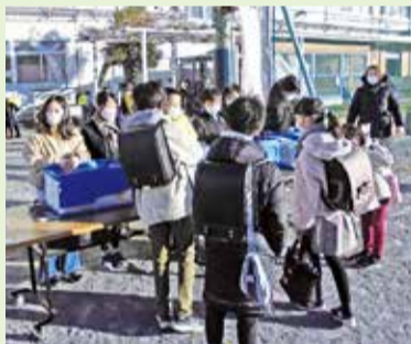
▲たくさん持ち寄ってくれました