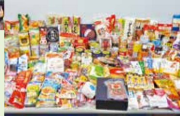
198点の物資が集まりました!