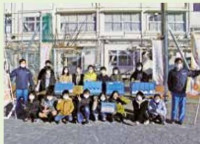
▲東希望が丘小学校は給食委員会を中心となってフードドライブを実施