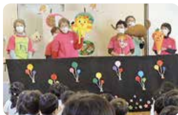
▲大好評! おにぎりあさひくん人形劇