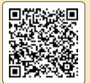
▲開設時間など詳細はこちら