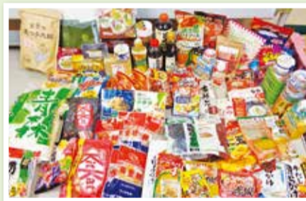
▲東希望が丘小学校は182点、希望が丘中学校は91点集まりました!