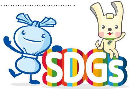
へら星人 ミーオ 「ヨコハマ3R夢!」マスコット イーオ