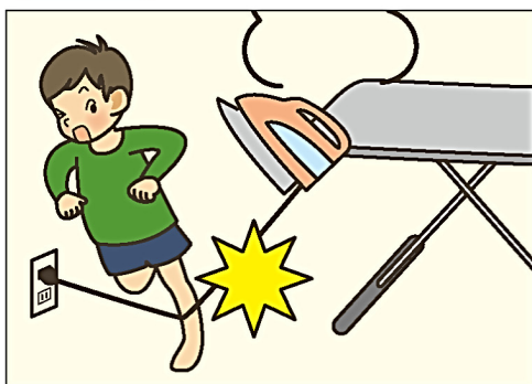
コードに足が引っかかり アイロンでやけど