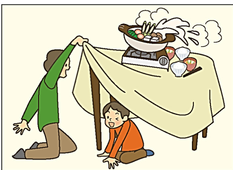
鍋が倒れてやけど