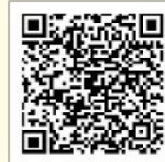
横浜市消防団 入団申請