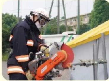
横浜市総合防災訓練