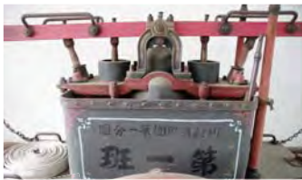
腕用 (わんよう) ポンプ

明治時代から昭和中期にかけて使われたポンプ。やはり人力ポンプですが、「吸管」というホースを用いて水利からポンプのちからで水を引き上げ、放水することができます。写真は、池辺町の消防団で使用されたもの。元々は赤色などに塗装され、装飾模様も施された美しいポンプであったようです。