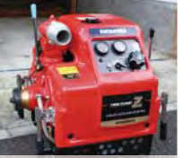
可搬式消防ポンプ

左の写真は現代の消防団の主力ポンプです。ガソリンエンジンを動力として放水を行います。このポンプは、1分間に500リットルの放水能力を有します。このポンプを搭載する車両が「可搬式消防ポンプ積載車」です。横浜市には普通車タイプと軽自動車タイプの積載車があります。右の写真の積載車は大きな照明装置も搭載するタイプで、夜間の活動にも威力を発揮しています。