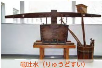
竜吐水 (りゅうどすい)

江戸時代から明治時代にかけて使われた人力ポンプ。放水の様子が龍が口から水を吐く様に似ていたことから名付けられました。桶などで人が水を入れながら、シーソーのように人が漕ぐことにより放水する仕組みで、放水能力はあまり高くなかったようです。写真は、改良型の「雲龍水」(うんりゅうすい)と呼ばれるもので、「龍が水を吐く」放水ノズルは無く、ホースを接続して送水することができます。佐江戸地区の消防組(現在の消防団)で使われていたものです。