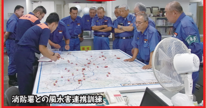
消防署との風水害連携訓練