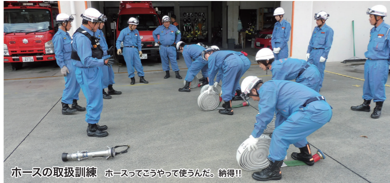
ホースの取扱訓練 ホースってこうやって使うんだ。納得!!