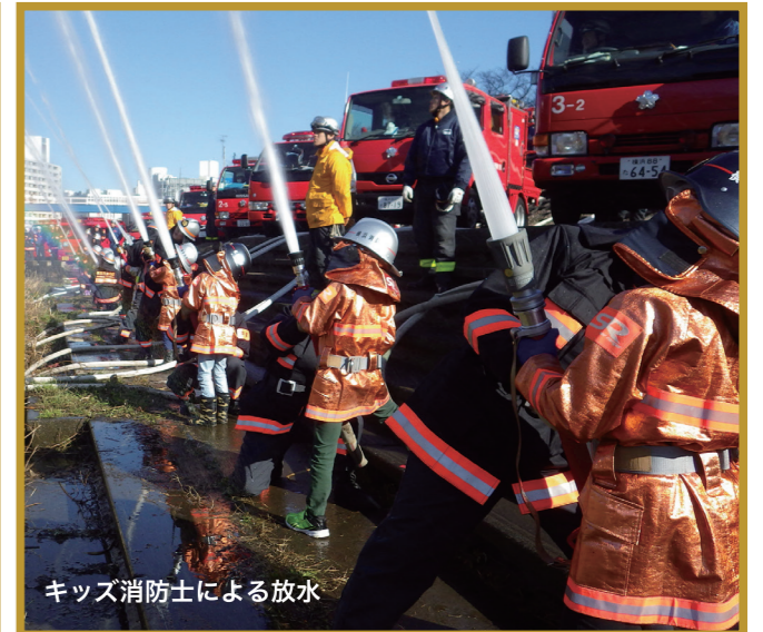
キッズ消防士による放水