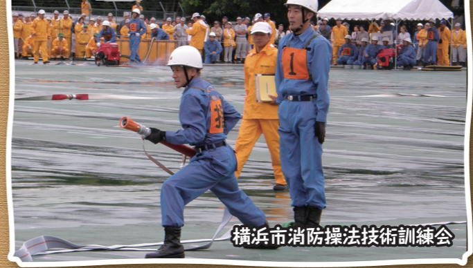
横浜市消防操法技術訓練会