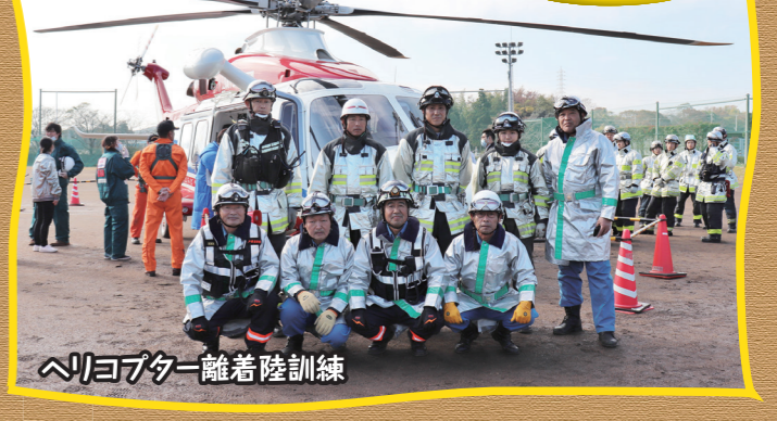
ヘリコプター離着陸訓練