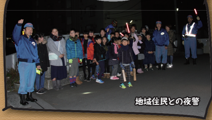
地域住民との夜警