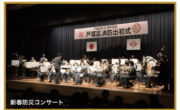
新春防災コンサート

戸塚区制80周年を迎える記念すべき年の最初のイベントとして、戸塚区消防出初式が行われました。「防災意識を未来につなぐ」をテーマに、更なる防災の輪をひろげることを目的として、消防団による一斉放水のほか、5歳から12歳までのキッズ消防士による放水演技が行われました。