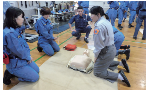
救急救命講習 胸骨圧迫は結構大変だ!!