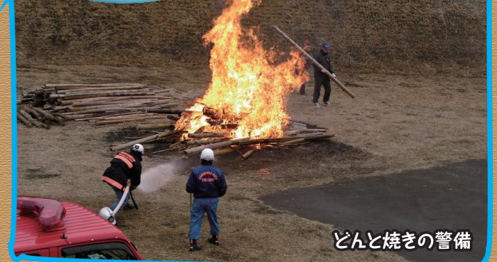
どんと焼きの警備