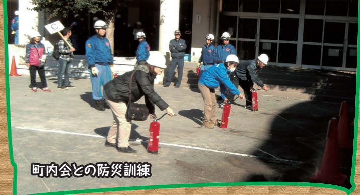
町内会との防災訓練