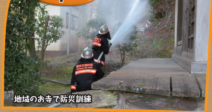
地域のお寺で防災訓練