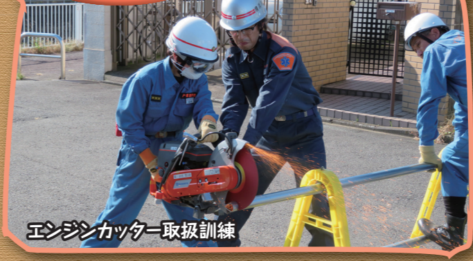
エンジンカッター取扱訓練