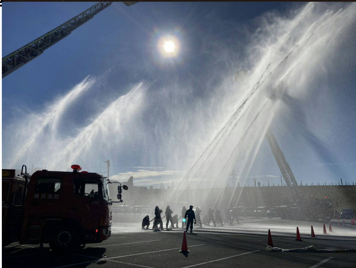
第3回港北消防フォトイベント