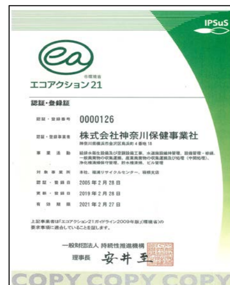
エコアクション21認定証