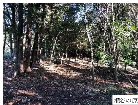
写真 9.14-9 瀬谷市民の森（令和 3 年 3 月 27 日撮影）