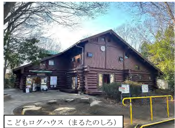
写真 9.14-3 瀬谷中央公園 (令和3年3月27日撮影)