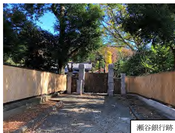
写真 9.14-5 鎌倉古道 北コース（令和2年11月28日撮影）