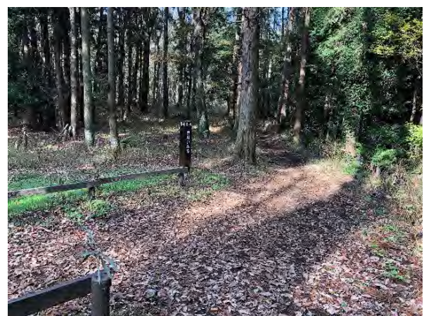
写真9.14-12 上川井市民の森（令和2年12月13日撮影）