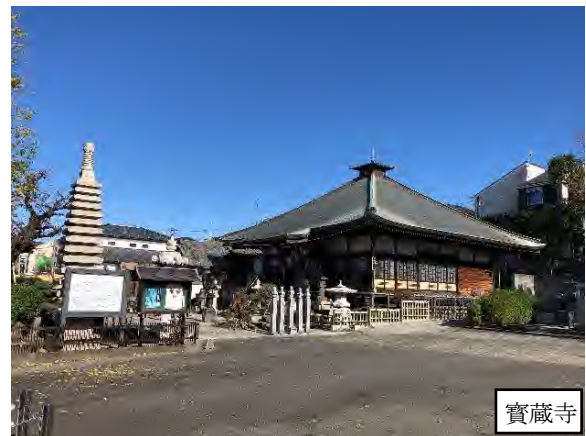
写真 9.14-6 鎌倉古道 南コース（令和 2 年 11 月 28 日撮影）