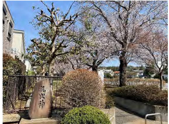
写真 9.14-2 東野第一公園（令和3年3月27日撮影）