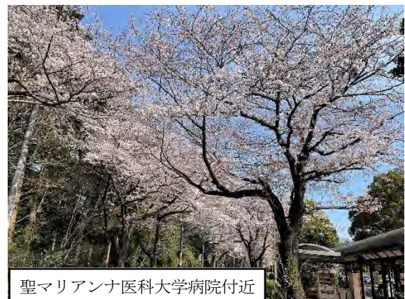
写真 9.14-7 野境道路（令和3年3月27日撮影）