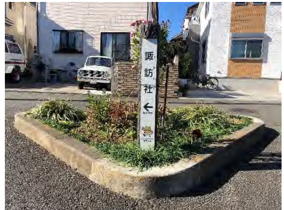
写真 9.14-8 武相国境・緑の森コース (令和2年11月28日撮影)