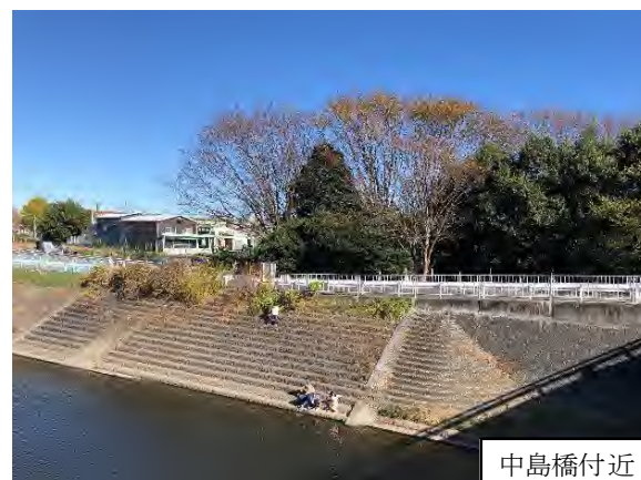
写真 9.14-4 境川沿い（左上は令和 3 年 2 月 23 日、それ以外は令和 3 年 3 月 27 日撮影）