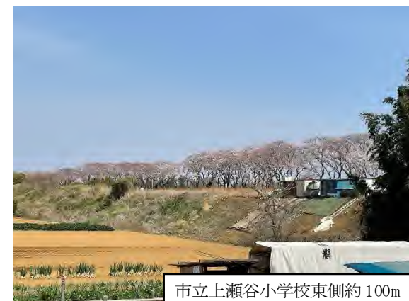
写真 9.14-1 海軍道路の桜並木（令和 3 年 3 月 27 日撮影）