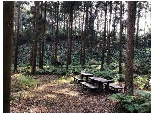
写真 9.14-10 追分市民の森（右上は令和3年3月27日、それ以外は令和2年12月13日撮影）