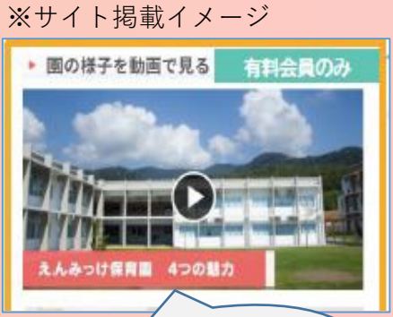
※サイト掲載イメージ