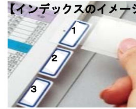
【インデックスのイメージ】