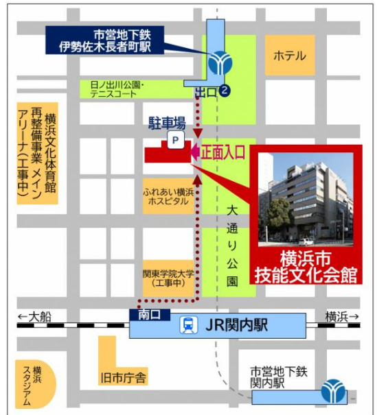
横浜市技能文化会館 案内図