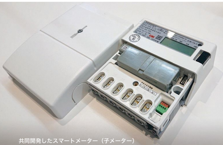
共同開発したスマートメーター（子メーター）

両社は、2020年に互いにアイデアと技術を提供し合い、新たな太陽光発電用のスマートメーターを共同で開発。横浜から、日本における太陽光発電の裾野を広げようと取り組んでいます。