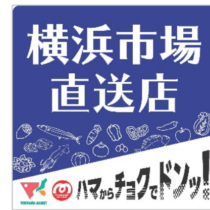
直送店ステッカー