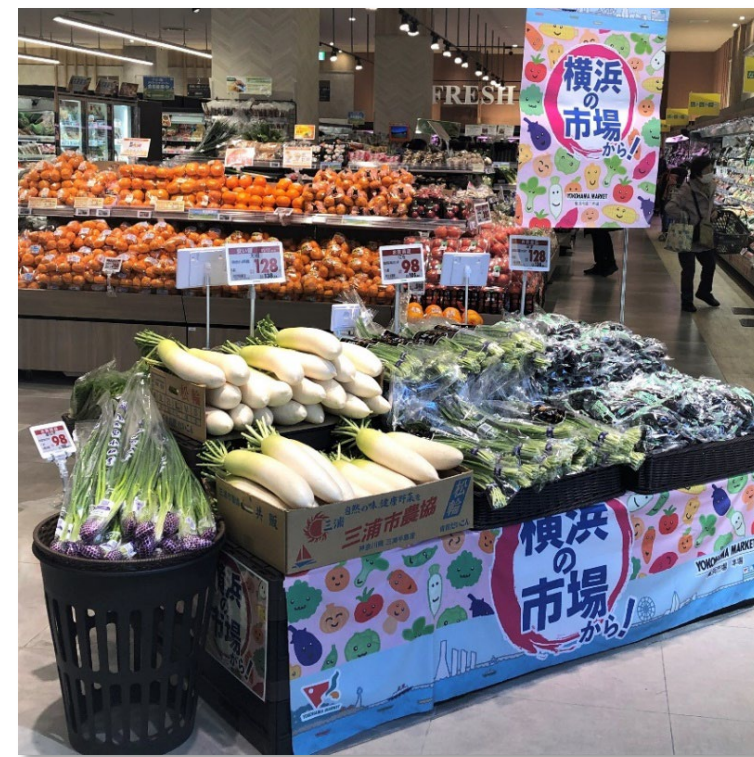
量販店での「横浜市場フェア」の様子