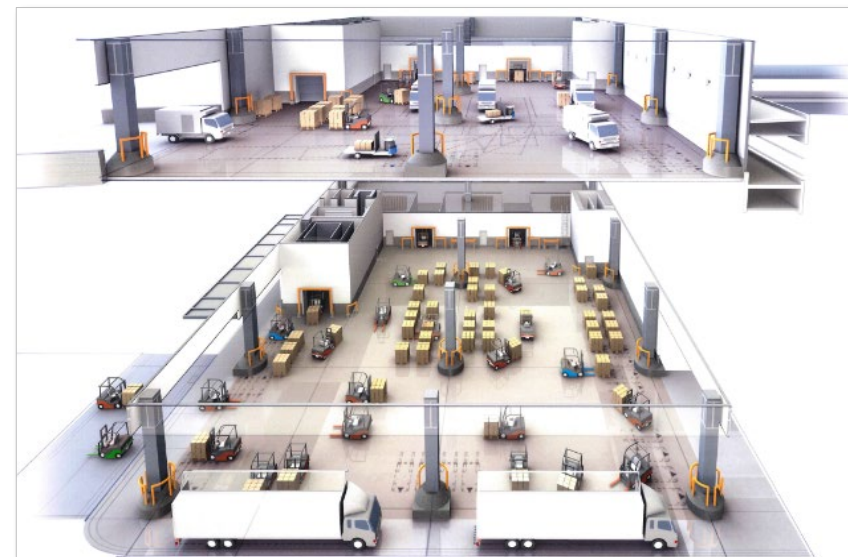
F1棟(1・2階断面図)イメージ