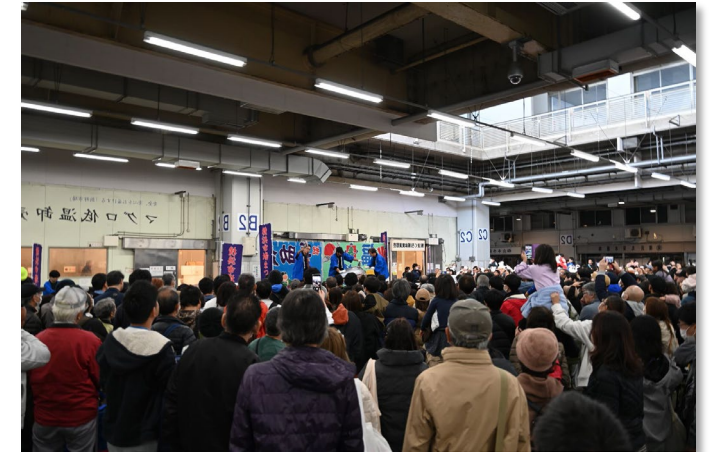
マグロ解体ショー (市場まつり)