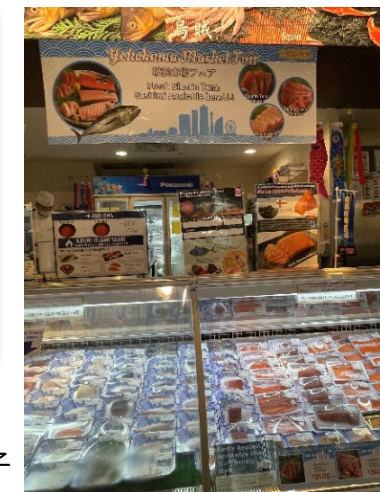
シンガポールの日系スーパー 「SAKURAYA」でのフェアの様子