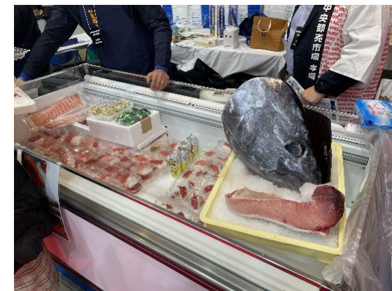
「FOODEX JAPAN 2024」@東京ビッグサイト（4日間開催）