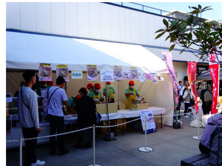
ハマモツ調理販売