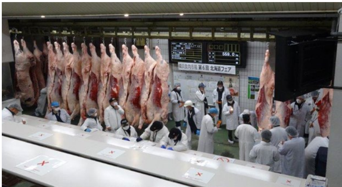
1/26 第6回北海道フェア せり場の様子

令和5年度は、牛枝肉品評会について全国から選りすぐりの肉牛を集める「ミートフェア」を1回、産地別に実施する「地方別フェア」を計8回開催し、積極的な集荷に取り組みました。