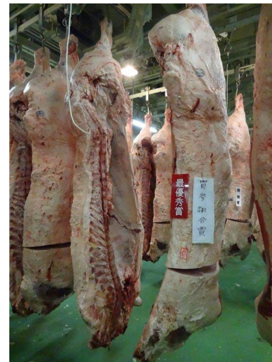
3/15 第5回東北フェア 最優秀賞