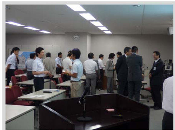
参加者間で活発な情報交換が行われた交流会