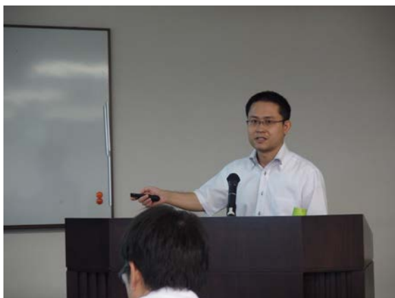
環境省 木野室長からの情報提供