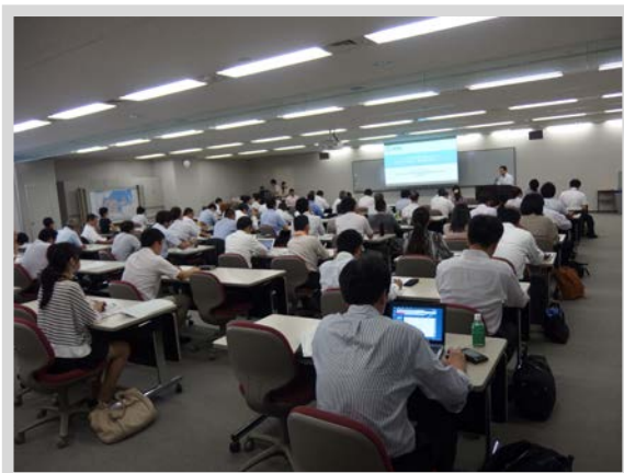
講演中の会場の様子