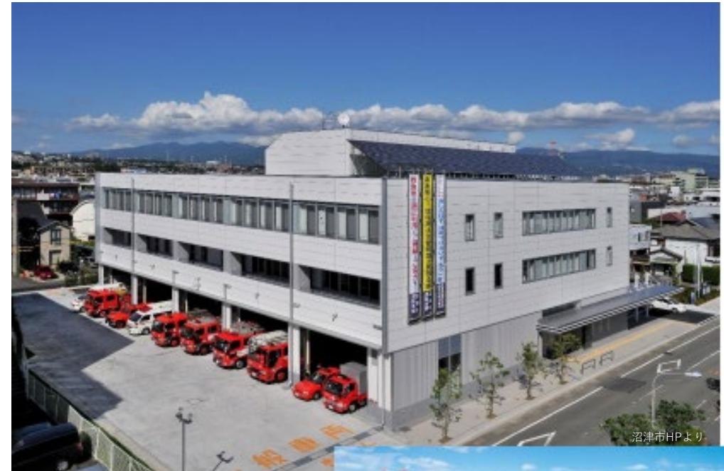
【沼津消防本部・北消防署庁舎】