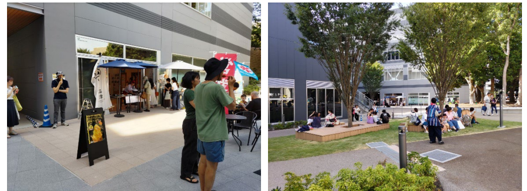
【自由提案施設運営状況】