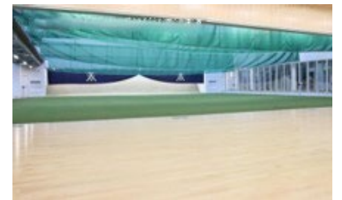
【香陵アリーナ（沼津市総合体育館）】