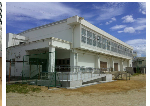
【屋内運動場空調設置・外壁補修等の実施状況】