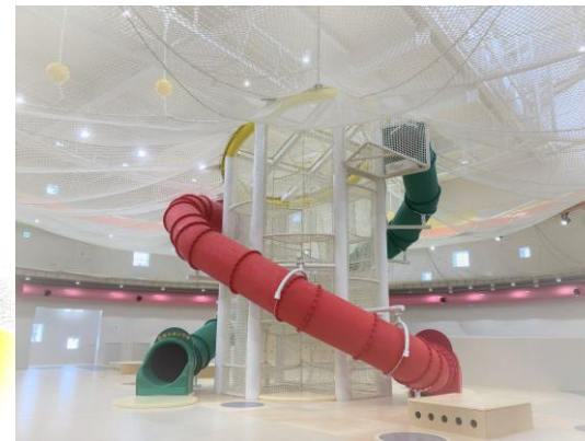
ネットジャングルジム