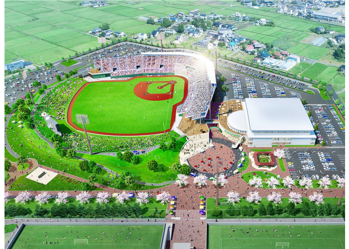
施設全体図（左：野球場、右：屋内練習場）