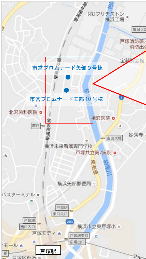
▲市営プロムナード矢部 位置図