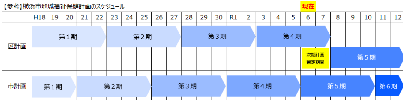
【参考】（別紙）令和7年度 第5期旭区地域福祉保健計画 策定スケジュール（案）