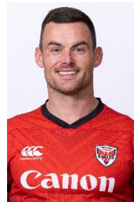
ジェシー・クリエル 選手 ラグビーワールドカップ 2023™ 南アフリカ代表