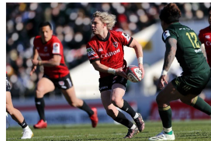
▲昨シーズンの試合の様子