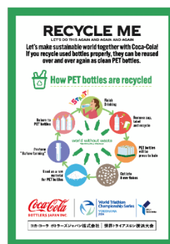
※ペットボトルリサイクルの啓発POP(予定)