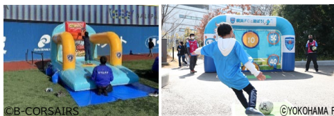
スポーツ体験コンテンツ