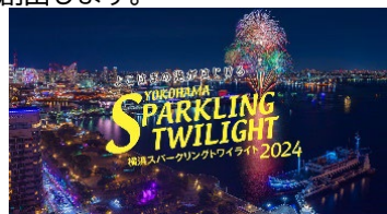
横浜スパークリングトワイライト2024 5月11日(土)20:00~20:05

その他、大会初日の夜に横浜スパークリングトワイライト2024を開催し、大会参加者等の滞在時間を延ばし、回遊性向上、宿泊の促進を図り、にぎわいを創出します。