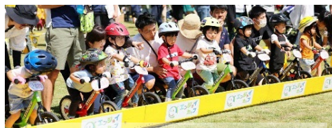
「ストライダー」イベント