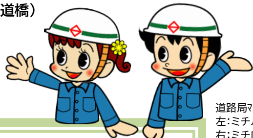
道路局マスコットキャラクター 左:ミチルちゃん 右:ミチローくん