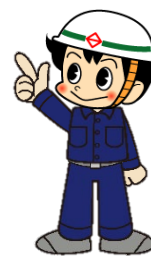
道路局マスコットキャラクター ミチローくん