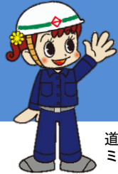
道路局マスコットキャラクター ミチルちゃん

横浜市では、道路の維持管理財源の確保、民間企業団体等の皆様へ地域活動及び社会貢献の場を提供することを目的として、市内の歩道橋を対象にネーミングライツ事業を実施しています。