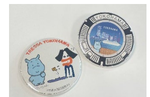
▲実際に作成できる缶バッジ <裏面あり>