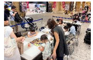
▲昨年度のイベントの様子