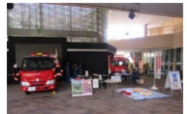
▼ 昨年度のイベントの様子