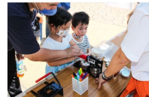
▲イベントのイメージ