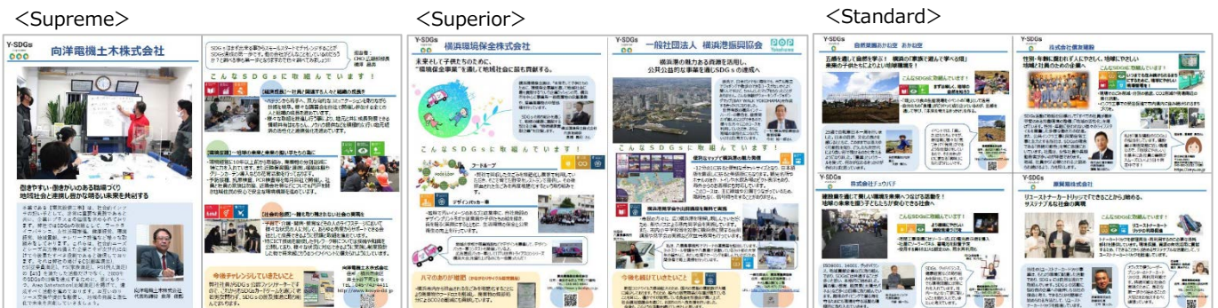
取組紹介シートの一例

全ての取組紹介シートはこちらからご覧いただくことができます。 (全認証事業者を対象に引き続き募集し更新予定)