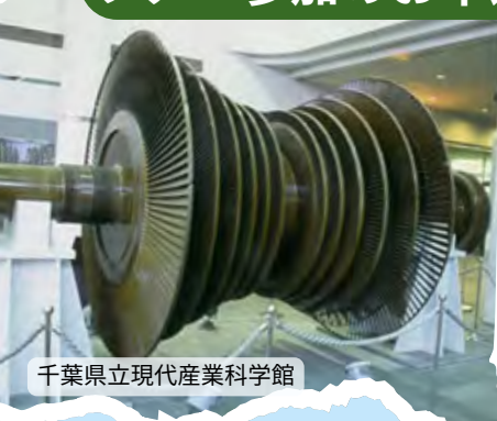
千葉県立現代産業科学館