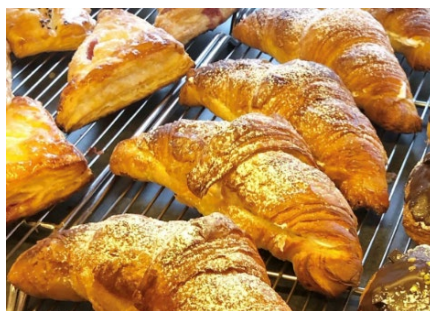
【販売品目（イメージ）】