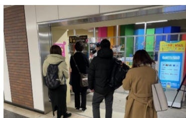
販売された商品は連日完売するほど大人気です！