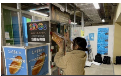
ロッカー型自販機に商品を搬入する様子

(市営地下鉄関内駅「SDGs ステーション横浜関内」フードロス・食品ロスを削減するロッカー型自販機を設置！)