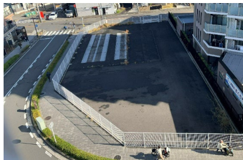
令和4年12月現在の様子（左が北・右が南）