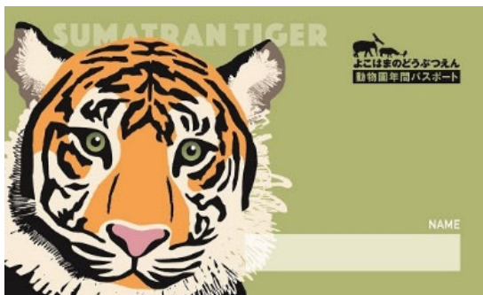
デザイン① スマトラトラ