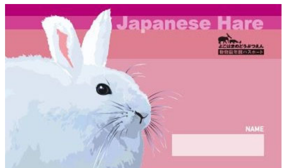
デザイン① トウホクノウサギ