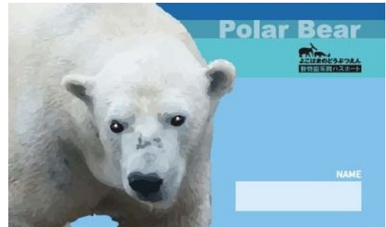
デザイン② ホッキョクグマ