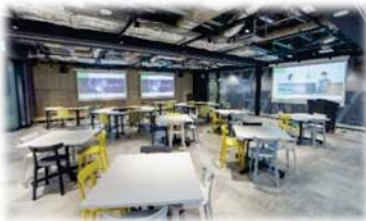
「NANA Lv. (ナナレベル)」

2 会場 横浜市立大学みなとみらいサテライトキャンパス(NANA Lv.内)(横浜市西区みなとみらい2-2-1 ランドマークタワー7階)と YOXOBOX(横浜市中区尾上町 1-6)、または オンライン(選択可)