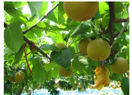
【野菜や果樹など様々な農業生産が行われている横浜（イメージ）】