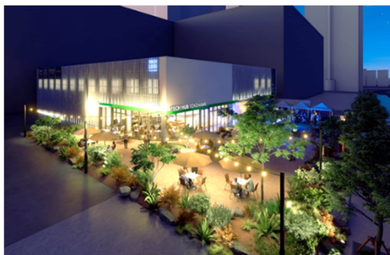
TECH HUB YOKOHAMA