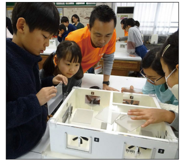
子ども向けワークショップの イメージ