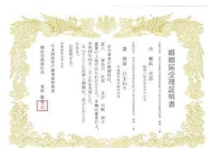
▲従来の市共通デザイン （賞状タイプ）