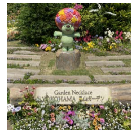
(写真)里山ガーデン・大花壇 (写真)ガーデンベン