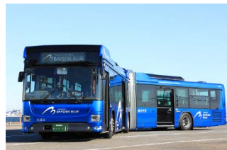
(写真)ベイサイドブルー