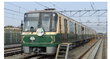
(写真)グリーンライン車両