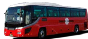
(写真)リムジン型バス

横浜駅東口集合＝里山ガーデン(開園前の大花壇に特別入場・自由散策)＝フォレストアドベンチャー・よこはま(ガイド付き散策)＝ランチ横浜南部市場・食の専門店街(自由昼食・散策)＝市電保存館(市電の歴史説明・自由見学)＝横浜駅東口にて解散