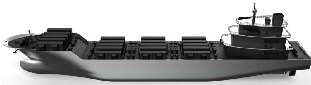
電気運搬船のイメージ図

電気運搬船は、船に搭載した蓄電池に蓄電し、電気を海上輸送するという世界初の送電手段です。我が国は2050年までにカーボンニュートラルの達成を目標に掲げ、洋上風力を中心に再生可能エネルギーの導入を促進しています。従来の火力電源とは異なり、再生可能エネルギーは、導入ポテンシャルが大きい供給元と電力の需要地が離れている場合が多く、その送電手段の強化が課題の一つとなっています。そこで、電気運搬船はこれらの課題の解決手段として可能性が期待されています。