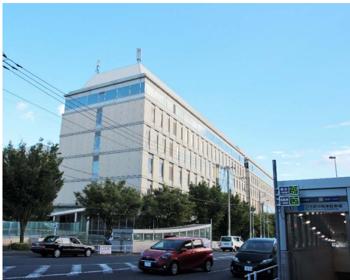
【建物外観（日吉駅前）】

慶應義塾大学日吉キャンパス内「協生館」 1階（約60㎡） 神奈川県横浜市港北区日吉四丁目1番1号