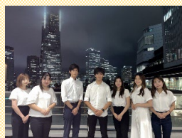
令和5年 二十歳の市民を祝うつどい実行委員会