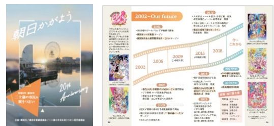
実行委員会が制作した記念冊子 （式典会場で参加者に配付）