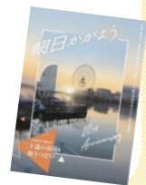
式典参加者に配布した 「記念冊子」