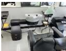
理容科のシャンプー台(最新モデル)