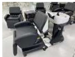
美容科のシャンプー台(最新モデル)