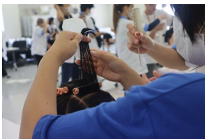
【美容科】ワインディング