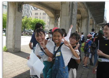
チームで助け合ってミッションに挑戦！

ミッションの難易度は様々。どのミッションから取り組むか英語で作戦会議を行い、ゲーム感覚で楽しみながらミッションクリアを目指します。