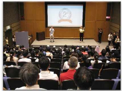
令和5年度 閉会式の様子