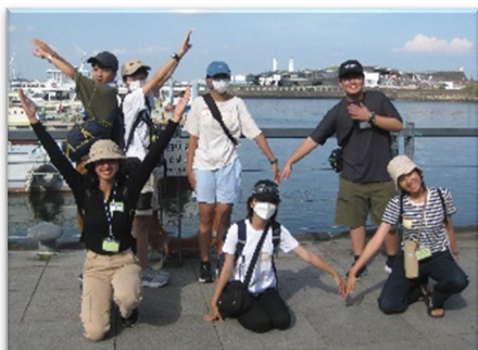
チームのみんなで横浜の魅力を発見・発信！