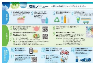
▲「取組メニュー」一覧