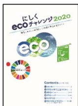
▲パンフレット表紙

ホームページの応募フォームまたはパンフレットの応募はがきに、取組内容と感想、希望する賞を書いて送ってください。第2希望まで賞を指定できます。