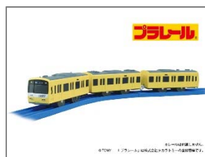
京浜急行電鉄：プラレール 京急新 1000 形 KEIKYU YELLOW HAPPY TRAIN