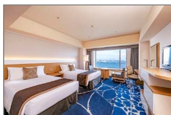
ヨコハマ グランド インターコンチネンタル ホテル： 宿泊ギフト券