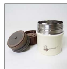
東京ガス：パッチョ THERMOS スープジャー