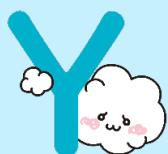
イメージキャラクター「ちゃっかる」

デートDVのことなら、どんなことでも相談できるチャット相談窓口「Yちゃっかる」を開設しています。被害を受けている本人や友人、家族、生徒のことが心配という方、あるいは、自分の行動がデートDVかもしれないと気付いた方からの相談も受け付けます。ひとりで悩まず、チャットで気軽に相談してください。