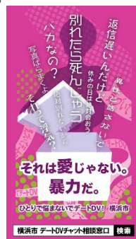
【デジタルサイネージ】