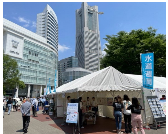
前回（令和4年度）の会場の様子