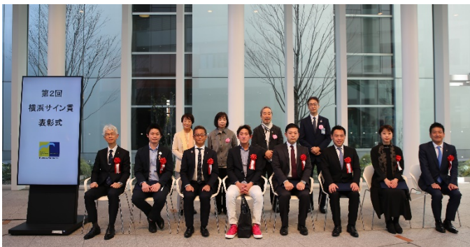
《受賞者の皆様、選考委員、都市整備局長》