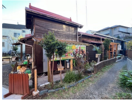
▲古民家を活用した居場所