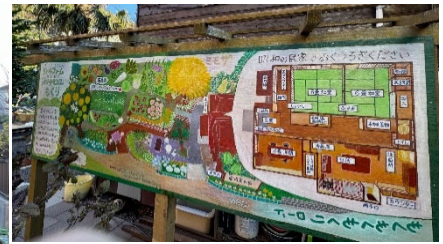
▲手書きで作成した園内案内板